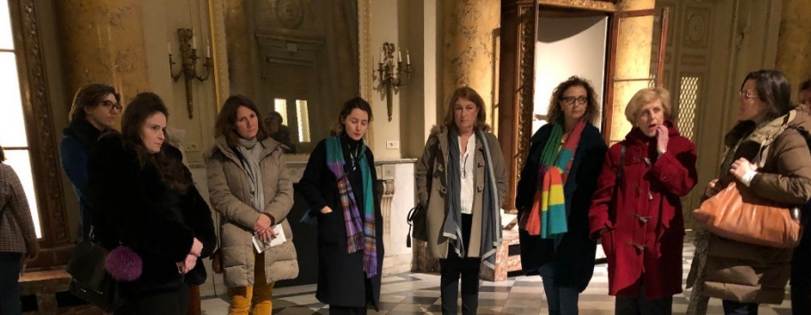
Commission DJ au Féminin du 17 décembre 2020

Réveille la créatrice qui est en vous : l'innovation juridique par le design