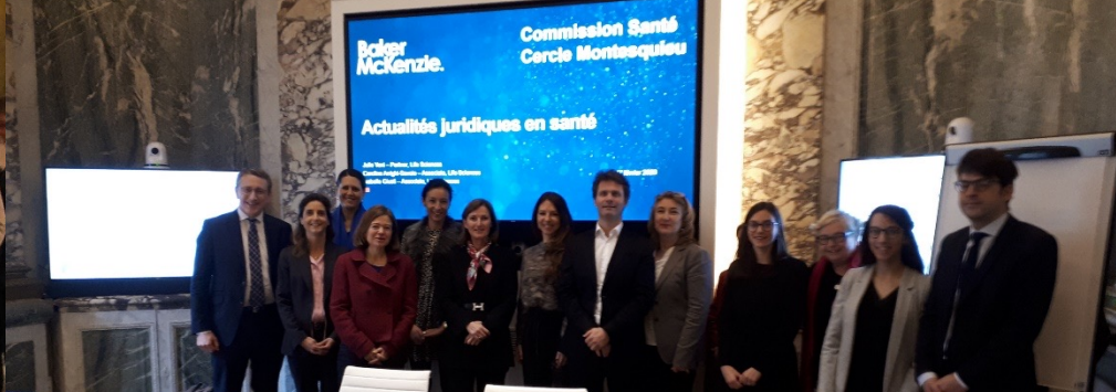
Commission Santé du 16 octobre 2020

Réveille la créatrice qui est en vous : l'innovation juridique par le design